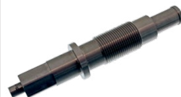
Tendeur de chaîne de mesure febi 40125

Applications: Véhicule Mercedes-Benz avec Moteur M271 avec chaîne à dents inversées Repl. no. 271 589 07 63 00