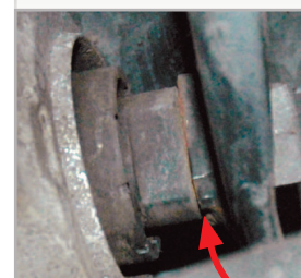
kit de rép. 21500/21502