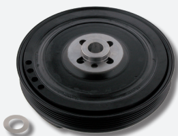
Ремкомплект шкива коленчатого вала