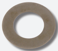
Шайба с алмазным покрытием

Во избежание возникновения дорогостоящего ущерба, шайба с алмазным покрытием непосредственно включается в ремонтные комплекты демпфирующих шкивов для таких моделей, как Volvo 850, S70, S80, V70 I, V70 II, VW Crafter/T4 и Audi A6.